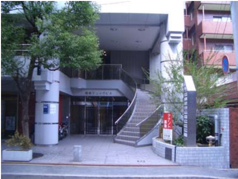
▲1 改装前 外観

計画地は、福岡の中心部やや北側の、中小のオフィスビル等が整然と建ち並ぶエリアにある。その一角にある、築16年の中規模オフィスビルを所有するクライアントより賃貸ビルとしての価値を高めたいという要望を受け、エントランスを主とした共用部分のリニューアルを行った。