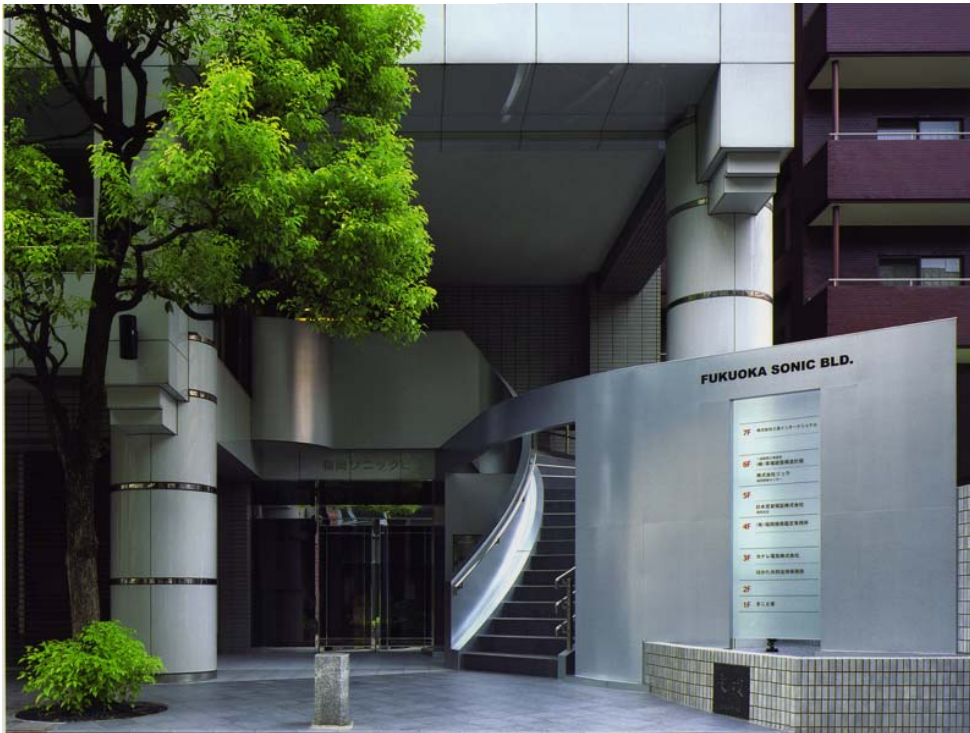
▲2 改装後 外観

このような条件のもとで、2枚の金属板が柔らかな弧を描きつつ既存建物を覆うというデザインを提案した。その2枚の金属板は、それぞれ建物の案内板・郵便ボックスと階段の手摺りという異なる機能を内包しながら建物を覆い、そして交差する。改修前のちぐはぐな意匠は2枚の金属板に統合され一体となり、エントランスはさらなる機能性と確固としたデザイン性を獲得することができた。これにより、建物としてのアイデンティティーを持つことができ、賃貸ビルとしての価値を高めることが出来ればと考えている。