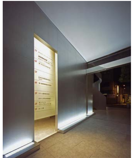
▲6 エントランスホール